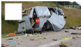
Spur der Verwüstung auf der A9 im Saale-Orla-Kreis