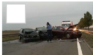
Massenkarambolage in Erfurt zwischen IKEA un...